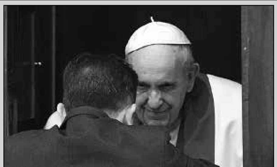
hoja

El Tennessee Register ® en Inglés (USPS 616-500) publica cada dos semanas por la empresa de Tennessee Register , 2800 McGavock Pike, Nashville, TN 37214-1402. El franqueo periódico paga en Nashville, TN 37214 y en las oficinas adicionales. Una suscripción: $26.00 por año en los Estados Unidos, $27.00 de exterior. Director general de correos: Por favor, envía los cambios de dirección al Tennessee Register , 2800 McGavock Pike, Nashville, TN 37214-1402.