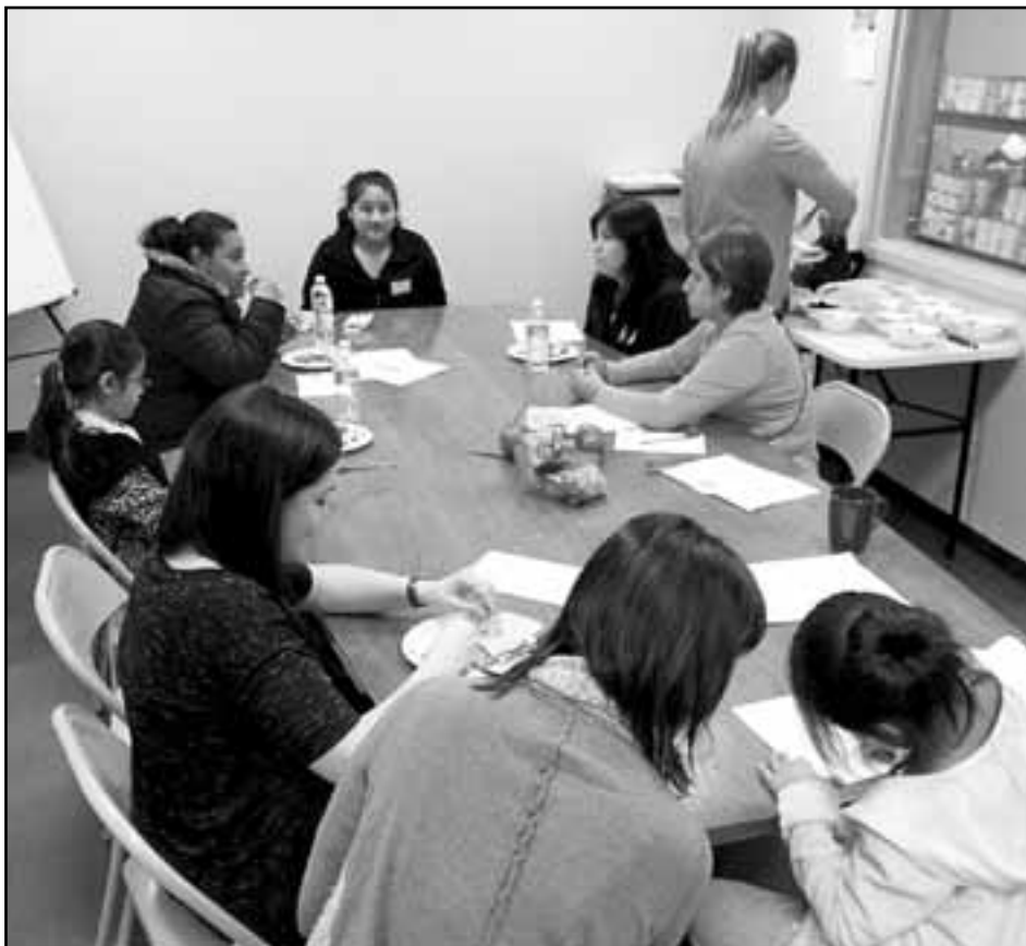
Las familias aprenden a preparar meriendas saludables después del día escolar en el Centro de Caridades Católicas y Recursos Familiares del Sur Nashville a través del programa de “Comunidades y Estudiantes Juntos por Servicios Mejorados de Aprendizaje”, desarrollado por estudiantes de la Universidad de Vanderbilt.

Los líderes del programa dependen en gran medida de “correr la voz” para invitar a la gente a participar. “Estamos a poca distancia de las comunidades de inmigrantes en el Sur de Nashville. Hay varios complejos de apartamentos cercanos que tienen grandes poblaciones de inmigrantes”, dijo Hayes. “Hemos desarrollado relaciones con muchos de